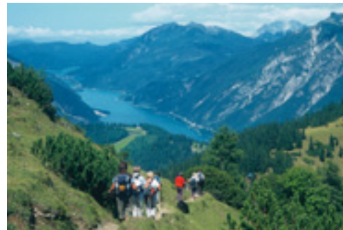
Abstieg vom Stanser Joch

Eine Bergwanderung ist bei (fast) jedem Wetter lohnend