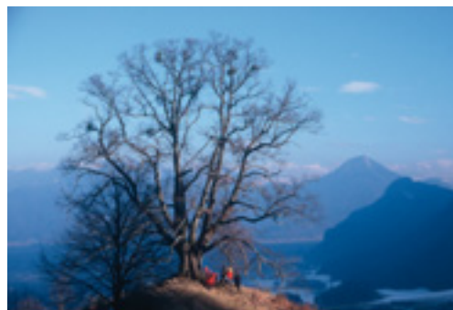
Über dem Inntal bei Brannenburg

wandern gehen und im Frühjahr durchs Voralpenland radeln.