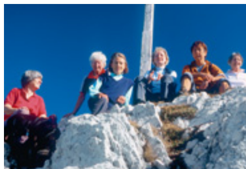
Auf dem Lacherspitz