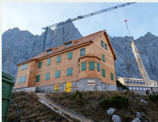
Die Falkenhütte der Sektion Oberland wird nach der Generalsanierung 2020 wieder ein beliebtes Ziel für Mountainbiker sein, jedoch keine E-Bike-Ladestationen anbieten.