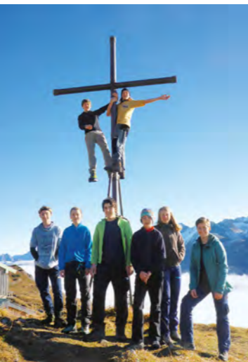
Text & Fotos: Berthold Fischer Gruppe: Jugend Z

Unser finaler Abstieg brachte uns wieder in den Herbst zurück – bei kühlerem und trübem Wetter und mit jeder Menge Laub zwischen den Beinen ging es zurück. Hoffen wir, dass die schönen Tage über den Wolken noch lange in Erinnerung bleiben werden!