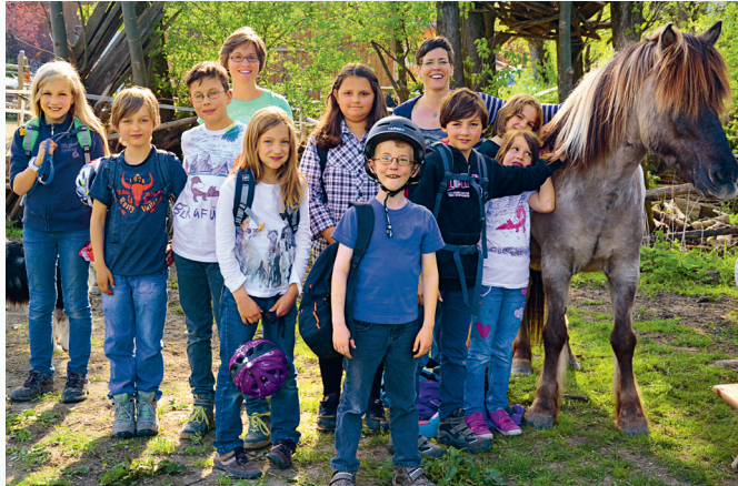
Die Bergfuchse: Miteinander stark sein, Spaß haben und spannende Sachen unternehmen